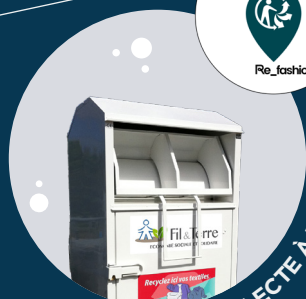
BORNE DE COLLECTE À TEXTILE

Tous textiles (habillement, linge de maison, chaussures liées par paires) usagés, quel que soit leur état, propres et secs, dans des sacs fermés. Ne pas déposer d'articles humides ou souillés.