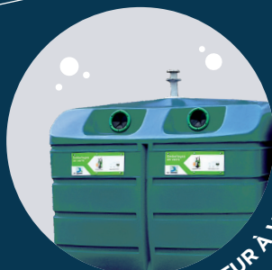
CONTENEUR À VERRE

Tous textiles (habillement, linge de maison, chaussures liées par paires) usagés, quel que soit leur état, propres et secs, dans des sacs fermés. Ne pas déposer d'articles humides ou souillés.