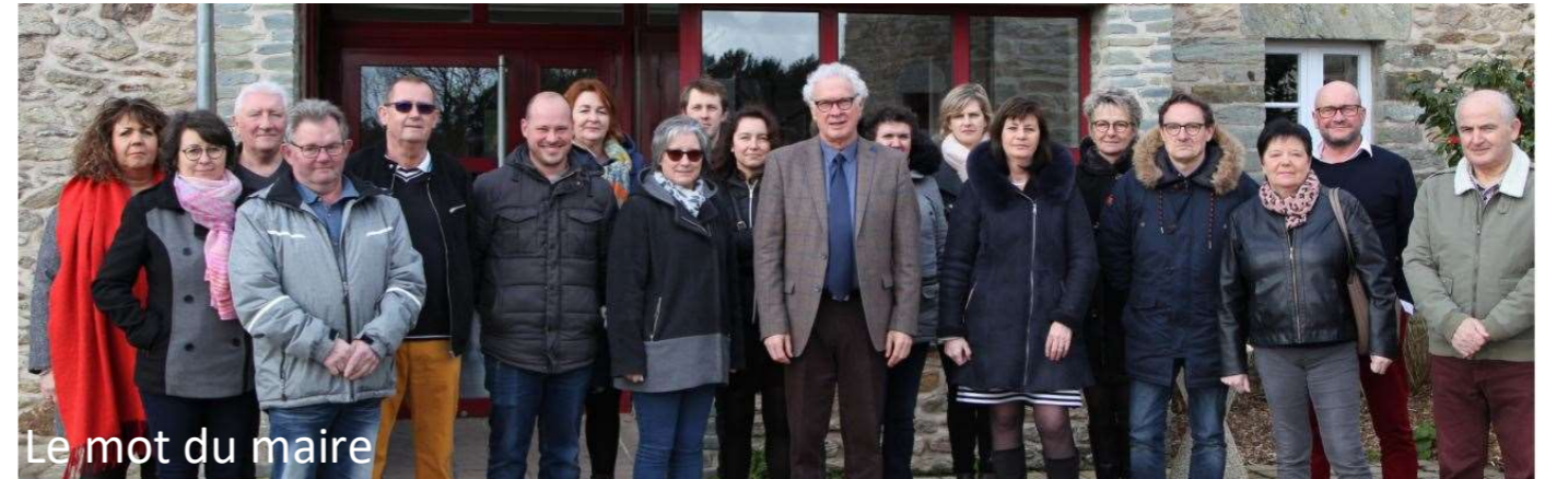
Le mot du maire